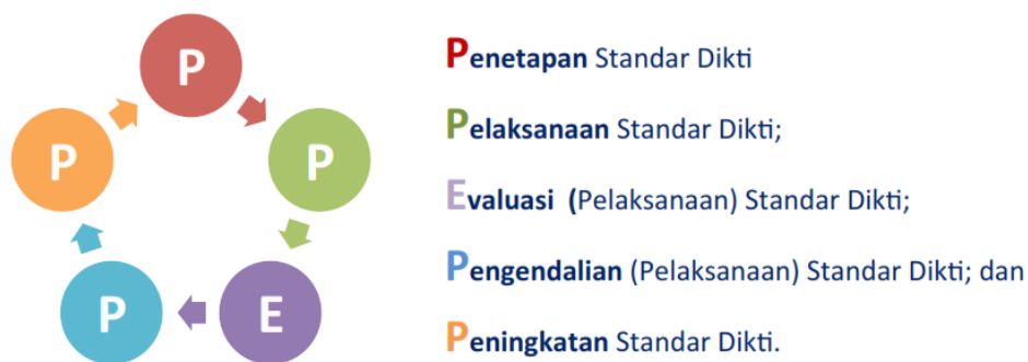
Gambar 1. Siklus SPMI

Dalam perencanaan, pelaksanaan, pengendalian dan pengembangan SPMI di Universitas Cendekia Mitra Indonesia mengikuti prinsip manajemen Standar dalam SPMI Standar Dikti) mencakup PPEPP (Penetapan, Pelaksanaan, Evaluasi, Pengendalian dan Peningkatan) seperti tersebut dalam gambar berikut ini: